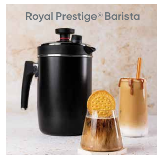
Royal Prestige® Barista