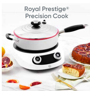
Royal Prestige® Precision Cook