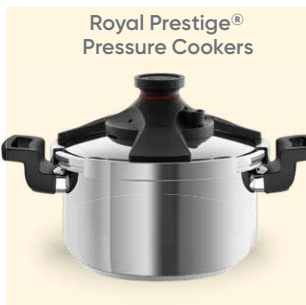
Royal Prestige® Pressure Cookers