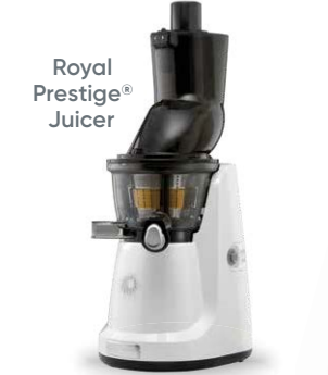
Royal Prestige® Juicer