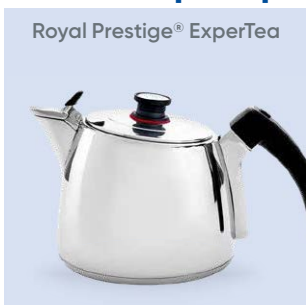
Royal Prestige® ExperTea