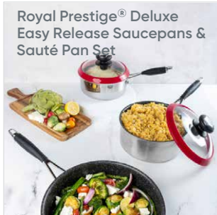
Royal Prestige® Deluxe Easy Release Saucepans & Sauté Pan Set