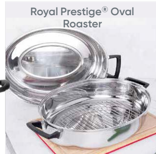
Royal Prestige® Oval Roaster