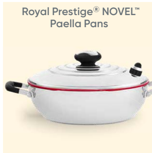
Royal Prestige® NOVEL™ Paella Pans