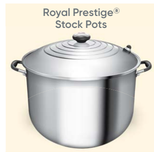
Royal Prestige® Stock Pots