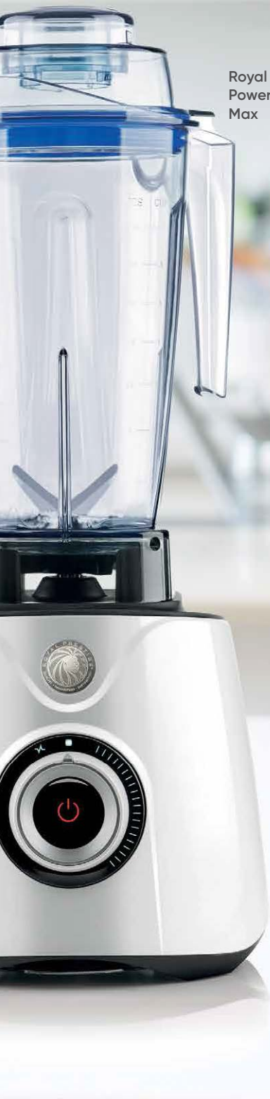
Royal Prestige® Power Blender Max