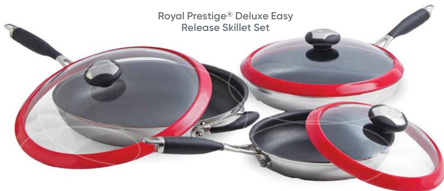
Royal Prestige® Deluxe Easy Release Skillet Set