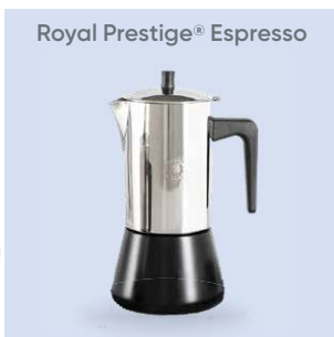
Royal Prestige® Espresso