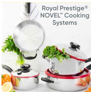
Royal Prestige® NOVEL™ Cooking Systems